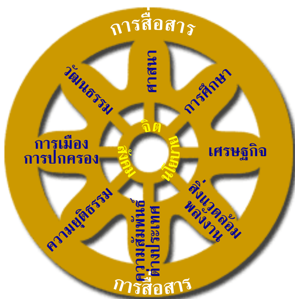
รูปที่ ๓ “ธรรมจักรเขี่ยนยุค”

ทุกคนสามารถร่วมในการเคลื่อน “ธรรมจักร” ไปสู่ยุคใหม่ได้